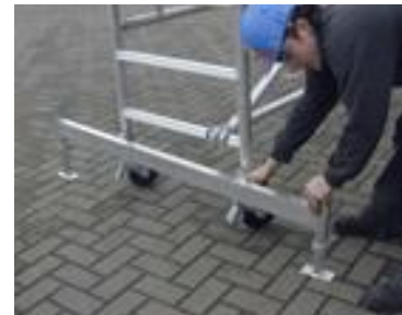
Steunbalk type PS01 en PS01A