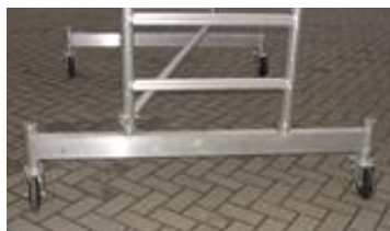
Zijsteunen type PS01A